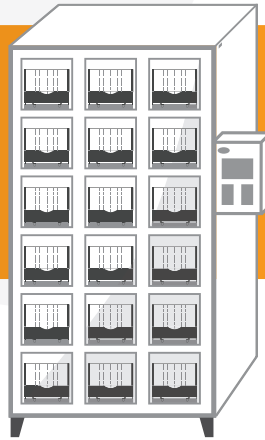
AXCESS 6518 Casillero de 18-Puertas Peso: 295 kg