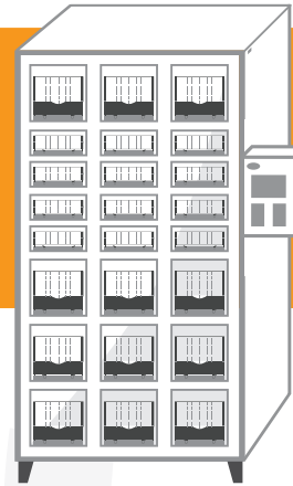
AXCESS 6524 Casillero de 24-Puertas Peso: 345 kg