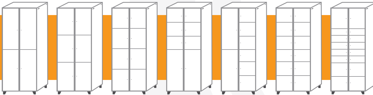
AXCESS 6804.S Casillero de 4-Puertas

Profundidad de compartimentos inferiores: 51 cm Capacidad de peso del compartimento: 20 kg