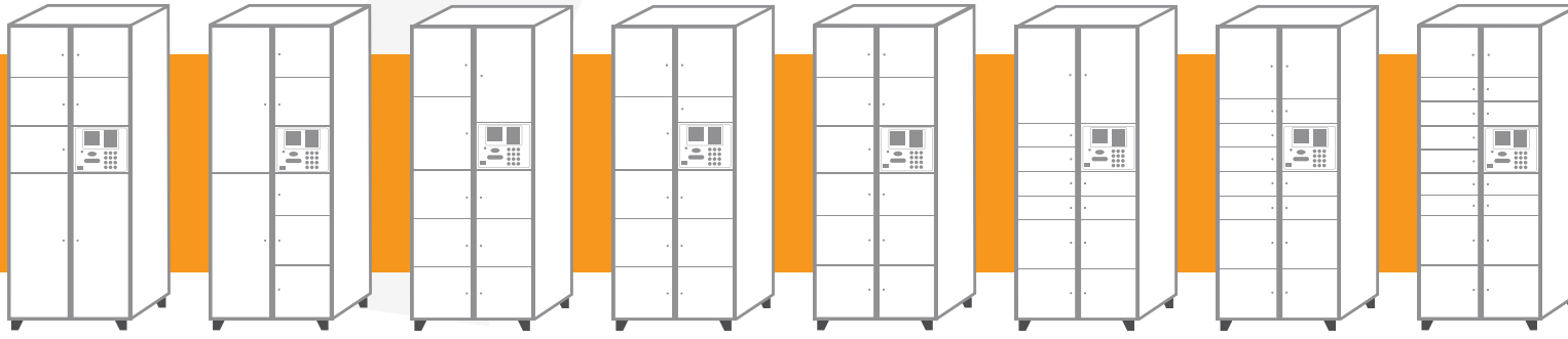
AXCESS 6807.CH Casillero de 7-Puertas